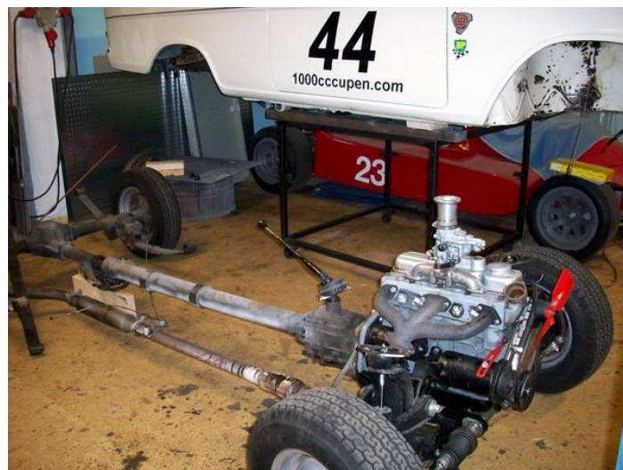
Hade bara 56 hästar på bakhjulen.